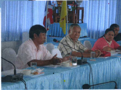
ภาพการประชุมสภาฯ สมัยสามัญ สมัยที่ 3 ครั้งที่ 1 / 2554 เมื่อวันที่ 14 มิถุนายน 2554 เพื่อพิจารณาร่างแผนพัฒนาสามปี พ.ศ. 2555-2557(ล่าง)